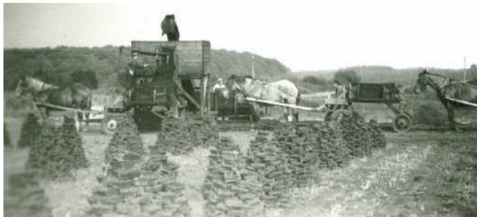
Tørv sat til tørre i røjler (stakke). (Fra Kvaerkeby.dk).

Mellem Vigersted og Kværkeby ligger et større moseområde. En mosaik af småsøer ses i landskabet. Søerne er opstået efter tørvegravning. I Danmark var der en generel mangel på brændsel under 2. verdenskrig. Den naturligt forekommende tørv blev derfor udnyttet som brændsel. Indtægter fra tørvegravningen ved Kværkeby var med til at føre det lille bysamfund gennem de økonomisk trange tider under 2. verdenskrig. I sommer-perioden var op til 500 mand beskæftiget med tørvegravning.